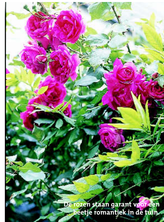
De rozen staan garant voor een beetje romantiek in de tuin.