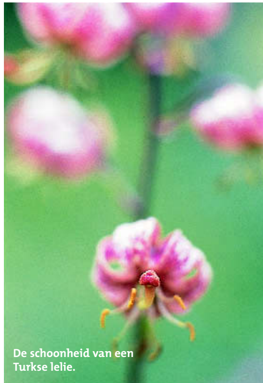
De schoonheid van een Turkse lelie.