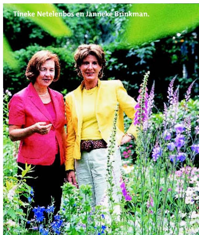
Tineke Netelenbos en Janneke Brinkman.

Ze hebben geen woord te veel gezegd: de voortuin van minister Tineke Netelenbos is inderdaad één grote bloemenzee. Het is overduidelijk, hier woont een echte tui- nierster met een grote liefde voor bloemen en kleuren. Digitalis, campanula, margrietten, ridderspoor, monnikskap, kortom, te veel om op te noemen. Mijn meegebrachte boeket tuinbloemen blijkt dan ook een schot in de roos te zijn. Even later, na een rondleiding door haar achtertuin, die op het noordoosten ligt en aan de achterkant begrensd wordt door een brede sloot met eendjes en meerkoe- ten, gaan we aan de lange tafel in haar huiskamer zitten. Kranten worden opzij geschoven, de koffie komt op tafel en het gesprek kan beginnen. ▷