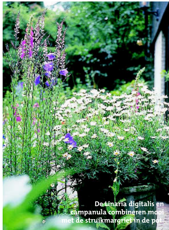
De Linaria digitalis en campanula combineren mooi met de struikmargriet in de pot.